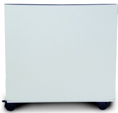
Support de rangement en option