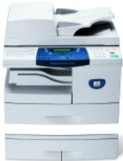
Bac papier supplémentaire en option